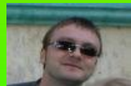
Президент ФС Португалии Red Max

Третья причина. Общаясь с ветеранами игры .. узнал такую вещь ! Что они не хотят играть из за того, что игра меняется .. и довольно стремительно - даже так сказать "без спроса". Что вдруг взбредет в голову администрации проекта .. не проведя детального опроса на форуме бух ... внедрили. Не все нововведения принимают люди, которые платят за игру деньги. Я по себе скажу, что самый стабильный ... сезон был 8 и 9. Ничего не менялось ... все было стабильно и привычно ... всё устраивало .. с 10 сезона все началось ... Хотя старики говорят ... что самые лучшие сезона .. даже были намного раньше ... 4 .. 5. Можно сказать с уверенностью, что именно третья причина - вызвали самый большой отток ветеранов- реальщиков.